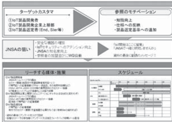
プロジェクト設計 (一例)