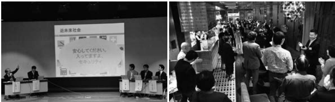
沖縄セミナーパネルディスカッションと終了後の交流会風景

JNSAのほとんどの活動は会員メンバーの自発的なアイデアや協力により運営されています。今回の企画のほとんどは社会活動部会で行いましたが、JNSAの活動に協力して下さる方々は随時募集しています。ぜひ色々なことをJNSAという場で試してみただけならと思っております。多くの方の活動への御参加をお待ちしています。