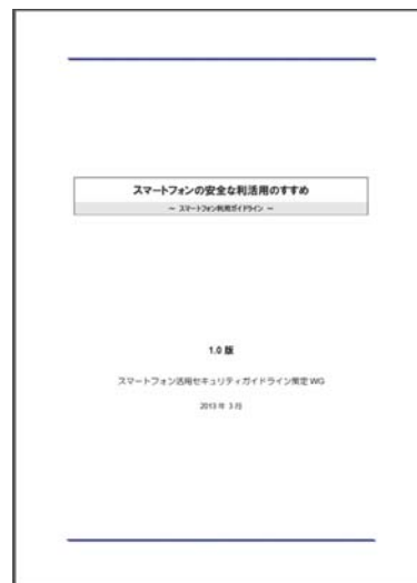
スタートアップガイド (仮)