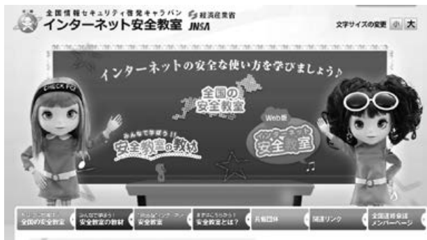
<インターネット安全教室トップページ> http://www.net-anzen.go.jp/

家庭や学校からインターネットにアクセスする一般の利用者を対象に、情報セキュリティに関する基礎知識を学習できるセミナーとして全国各地の関係団体等と協力して実施しています。